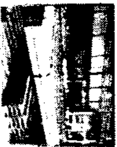
Parallel Flange Beams